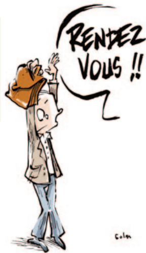
RENDEZ-VOUS DE CARRIÈRE

“ Aujourd'hui, j'ai reçu l'appréciation finale de l'IA-DASEN : « Satisfaisant » alors que ma note d'inspection est de 18/20 et que dans le tableau il y avait coché (4 satisfaisants – 6 très satisfaisants et 1 excellent) et que l'appréciation de l'IEN était très bonne. Sur quels critères s'est-elle arrêtée ?